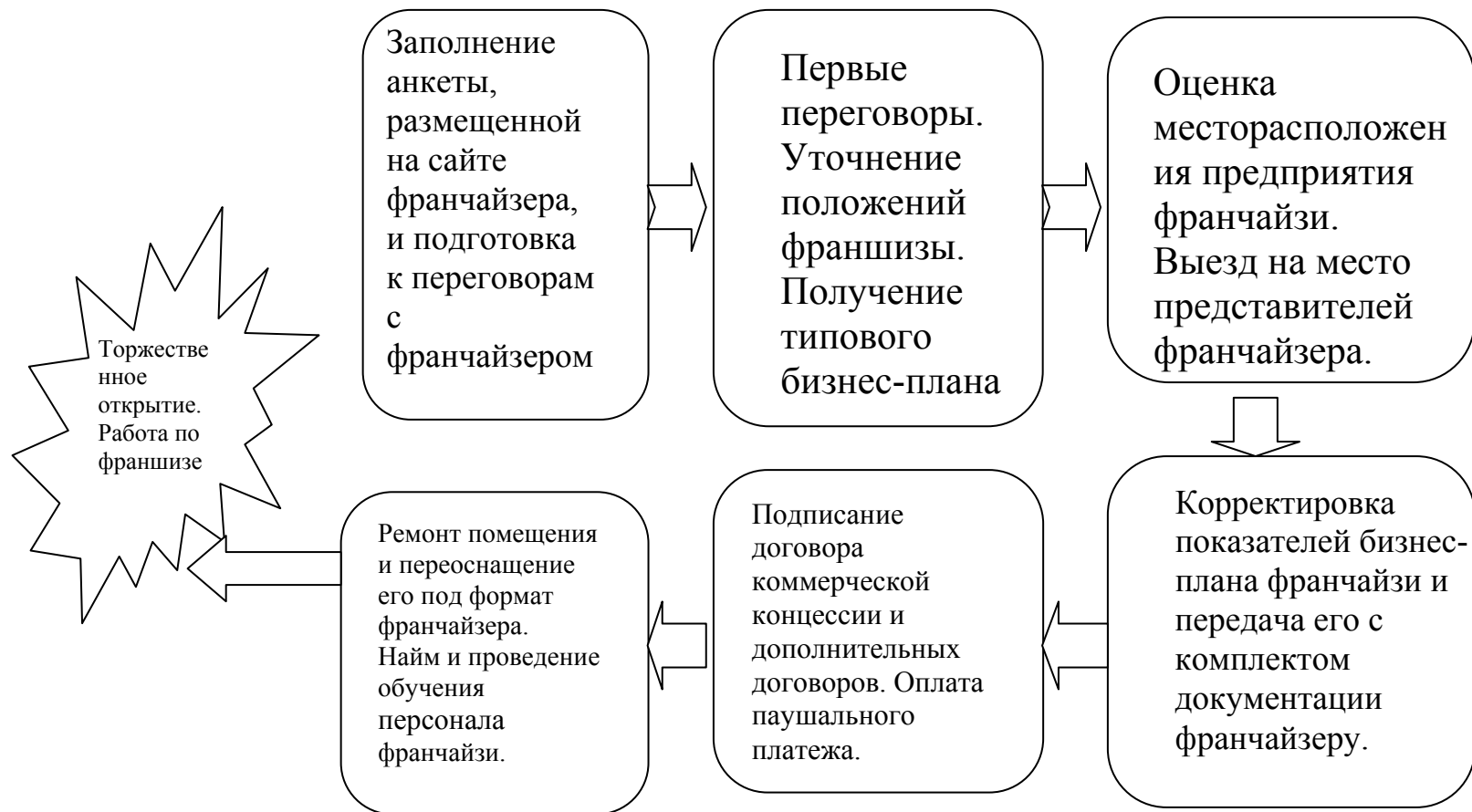
Рис. Процедура открытия кафе по франчайзингу